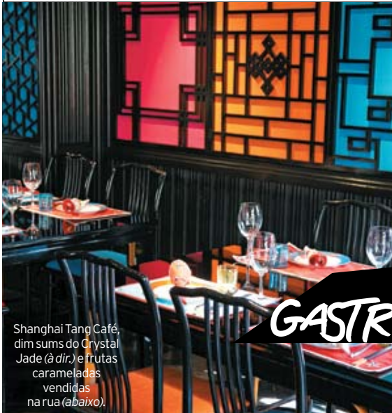
Shanghai Tang Café, dim sums do Crystal Jade (à dir.) e frutas carameladas vendidas na rua (abaixo).