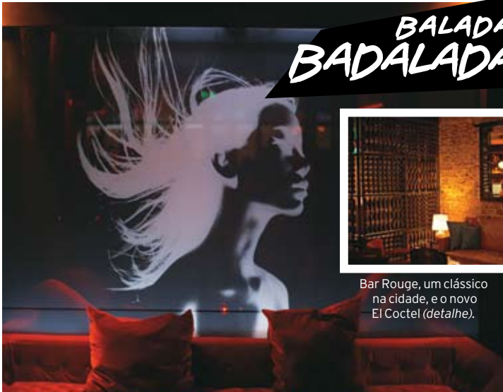
Bar Rouge, um clássico na cidade, e o novo El Coctel (detalhe).

Fashionistas, executivos, alternativos e outras tribos concordam em um ponto: Xangai precisa ser experimentada à noite. Os prédios da área de Bund abrigam bares e casas noturnas glamourosos. O Bar Rouge , sucesso há cinco anos, foi recém-reformado e atrai multidões. Há outras ótimas opções, como o Mint , que está bombando principalmente entre os estrangeiros residentes. Igualmente animados são os clubs da região conhecida como French Concession. Duas dicas por lá: o bacanérrimo YY e o novíssimo e agitadíssimo El Coctel .