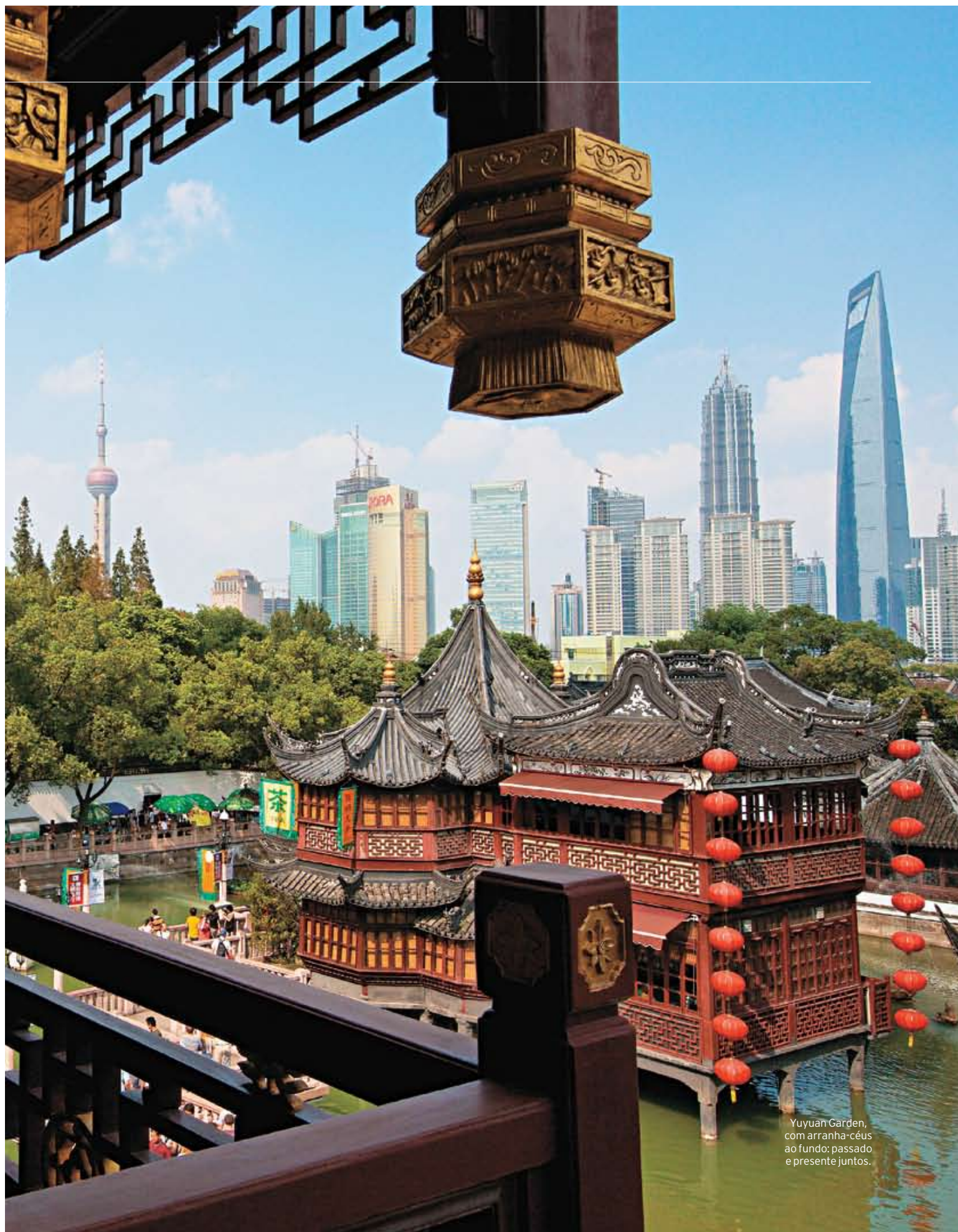
Yuyuan Garden, com arranha-céus ao fundo: passado e presente juntos.