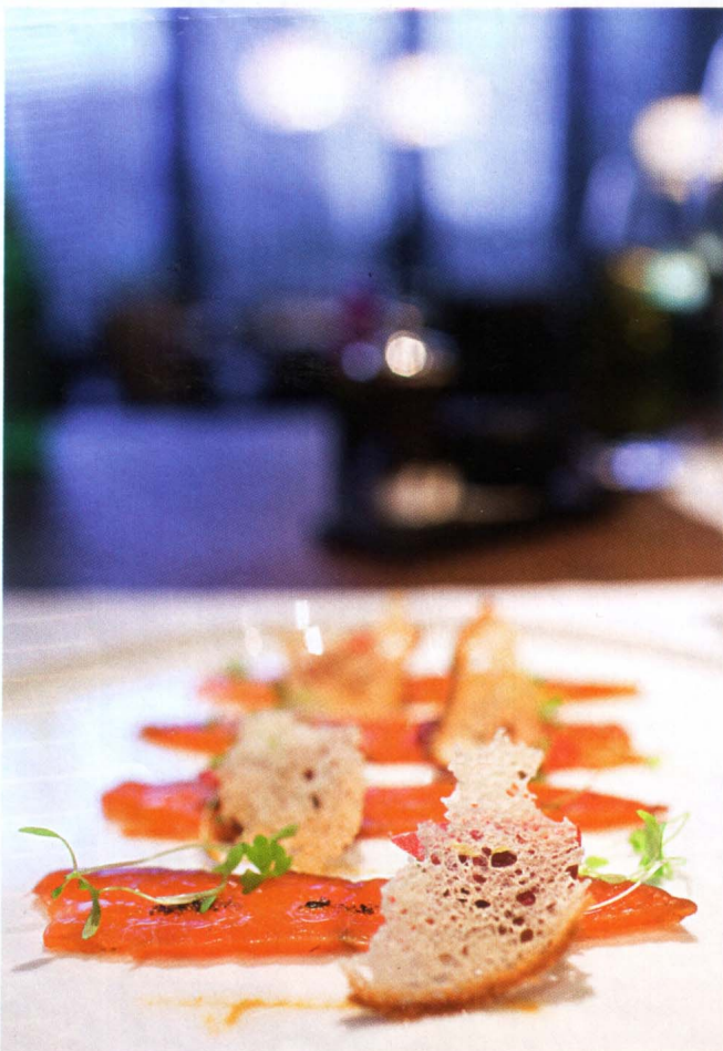
ENTRÉE ASIATISANTE AU RESTAURANT DE L'HÔTEL PULLI.