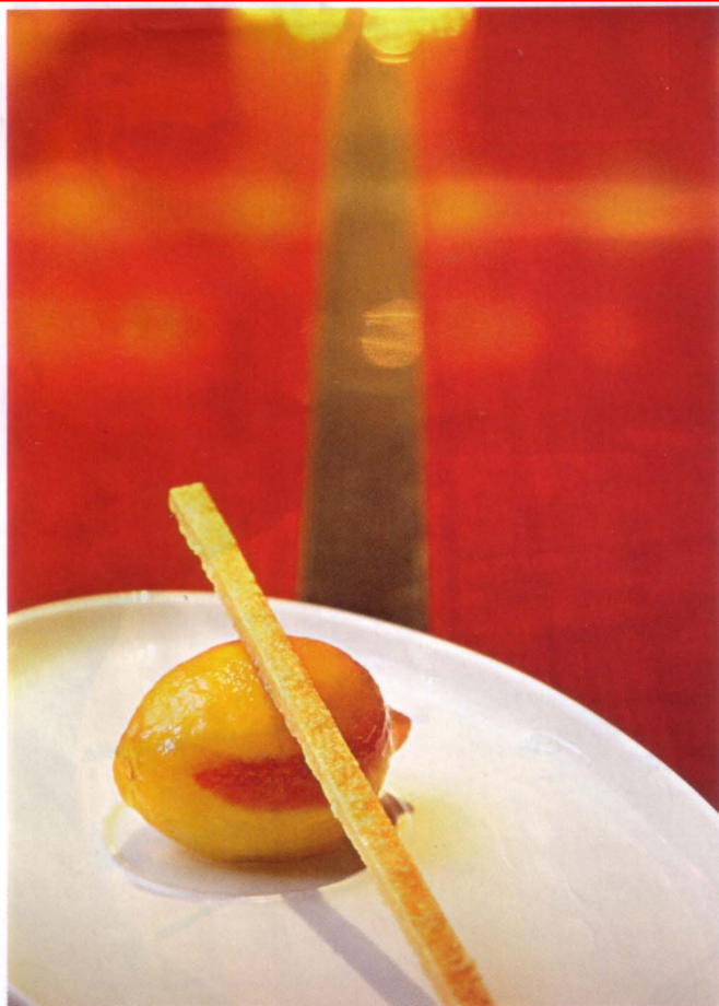
TARTE AU CITRON DÉSTRUCTURÉE AU MR & MRS BUND.