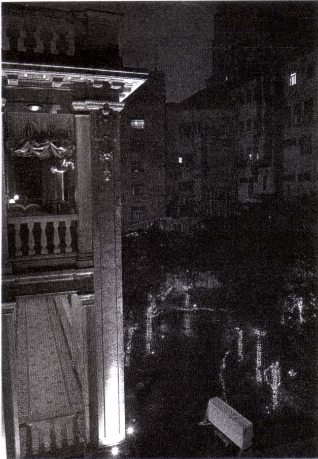
VUE DU KEE CLUB.