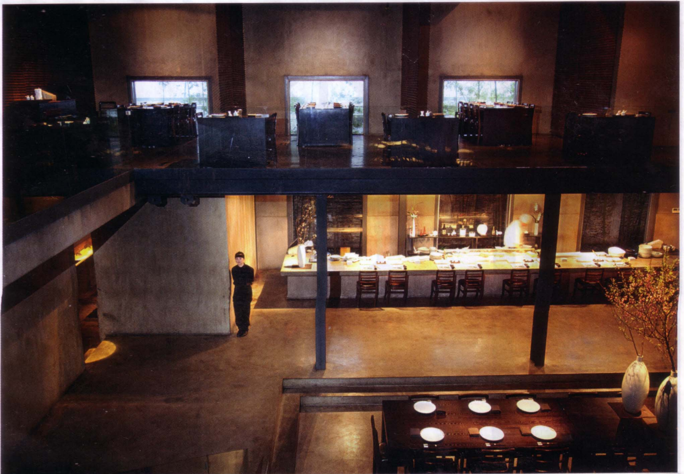
DÉCOR MINIMALISTE AU SHINTORI.